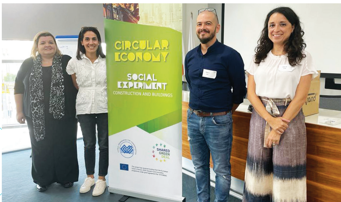
Εργαστήριο χαρτογράφησης κυκλικής οικονομίας

τη διάρκεια του πειράματος, ο CYS δημιουργεί ένα Local Accelerator Hub (LAH), με κύριο σκοπό τη συγκέντρωση και ανταλλαγή εμπειρογνώμοσύνης σε εθνικό επίπεδο σχετικά με βέλτιστες πρακτικές για βιώσιμα και κυκλικά επιχειρηματικά μοντέλα. Παράλληλα, το πείραμα στοχεύει στη στήριξη των τοπικών επιχειρήσεων στον τομέα της καινοτομίας και την προώθηση της εισαγωγής εννοιών κυκλικής οικονομίας. Μέσω του πειράματος, επιδιώκεται επίσης ο προσδιορισμός των τοπικών αναγκών και προκλήσεων και η εξεύρεση κοινών συντονισμένων λύσεων. Για τη διεκπεραίωση αυτού του πειράματος, ο CYS διοργανώνει μια σειρά εργαστηρίων για τον εντοπισμό και καταγραφή των υφιστάμενων καλών πρακτικών, τον προσδιορισμό και ανάπτυξη κοινών κυκλικών επιχειρηματικών λύσεων και τον καθορισμό των βασικών αναγκών και συμπεριφορών των χρηστών.