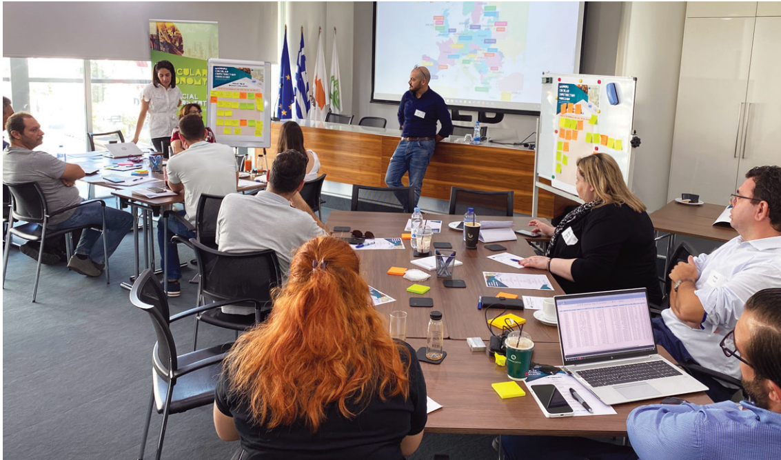
Το πρώτο Εργαστήριο του Κοινωνικού Πειράματος για την Κυκλική Οικονομία στις Κατασκευές και τα Κτίρια, πραγματοποιήθηκε με επιτυχία στις 13 Οκτωβρίου 2023