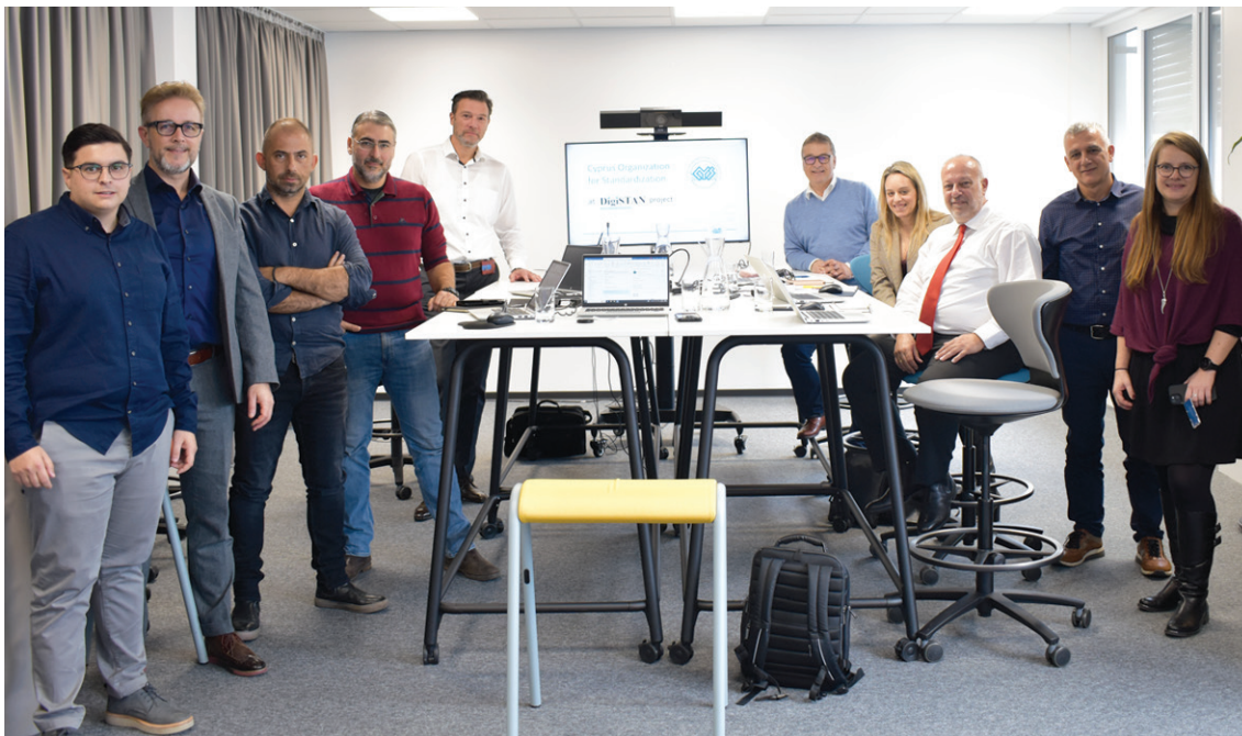
Ο Διευθυντής Τυποποίησης ηγήθηκε αντιπροσωπείας του CYS σε ροή του ευρωχρηματοδοτούμενου Προγράμματος DigiSTAN (ERASMUS+) στον Γερμανικό Οργανισμό Ηλεκτροτεχνικής Τυποποίησης DKE, 30/10 - 04/11/2023

Το χρηματοδοτούμενο πρόγραμμα “DigiSTAN - Moving Forward to New Digital Era through Standardisation” υλοποιείται στο πλαίσιο του Ευρωπαϊκού Προγράμματος Erasmus+. Έχει διάρκεια 12 μηνών και πραγματοποιείται σε συνεργασία με τον Εθνικό Οργανισμό Ηλεκτροτεχνικής Τυποποίησης της Γερμανίας DKE-VDE. Στόχος του προγράμματος, είναι η προετοιμασία του CYS για τον ψηφιακό μετασχηματισμό, στο πλαίσιο της εφαρμογής της Νέας Ευρωπαϊκής Στρατηγικής για την Τυποποίηση που εκπονήθηκε και αποσκοπεί στη δημιουργία βιώσιμης, πράσινης και ψηφιακής μεταμόρφωσης του οικοσυστήματος της Ευρώπης. Τον Νοέμβριο του 2023, πραγματοποιήθηκε η πρώτη φάση του προγράμματος κατά την οποία έγινε εκπαίδευση 8 στελεχών του Κυπριακού Οργανισμού Τυποποίησης στα γραφεία του DKE-VDE στη Φρανκφούρτη της Γερμανίας. Η δεύτερη φάση η οποία θα ακολουθήσει στην Κύπρο στις αρχές του 2024, περιλαμβάνει τη διεξαγωγή τριών εργαστηρίων σε συνεργασία με τα ενδιαφερόμενα μέρη τα οποία θα υλοποιηθούν υπό την καθοδήγηση των Γερμανών εμπειρογνομώνων.